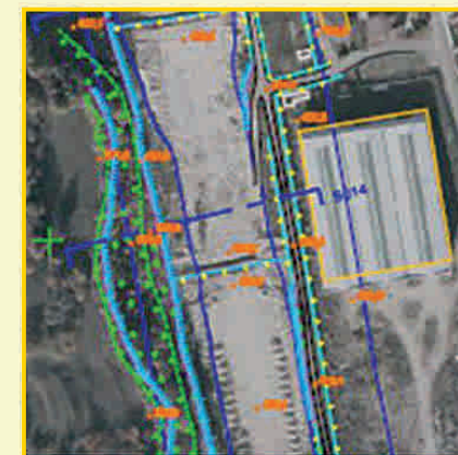
■ 2004 Ortofoto / Aerofotogrammetria Torrente

Rilievi per georeferenziazione e livellazione di piezometri e sondaggi all'interno di stabilimenti petrolchimici e per la progettazione di linee ferroviarie.