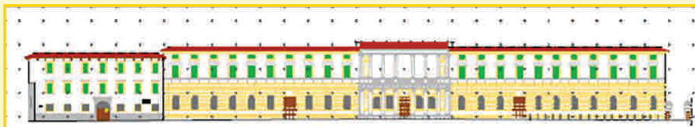
■ 2004 Verona

Rilievi idrografici e topografici nella Laguna Veneta.